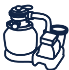
Filtration à sable Norme NF P 90-318